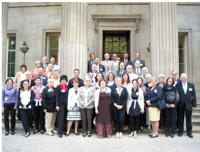
Presidentes de las distintas Asociaciones Europeas de justicia lega que firmaron la Declaración de Londres de Jueces Legos.

Debemos señalar que todo el esfuerzo económico de participación en este hito o logro histórico, ha salido de nuestra Asociación tras la aprobación en la Asamblea General llevada a cabo en la localidad de Mijas en el año 2010 y la ratificación en la del presente ejercicio celebrada en Albox.