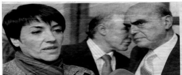
La consejera de Justicia y el presidente del TSJA (a la derecha) antes de la reunión de los vocales territoriales del CGPJ en Granada