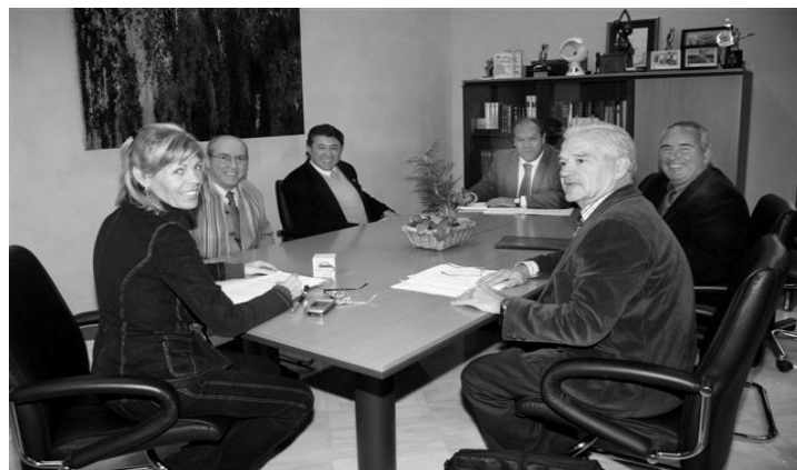
Reunión en la cual se acordó solemnemente disponer la inclusión de los denominados secretarios "idóneos" en la Bolsa de Interinos. Ver Circular 52.

Claro que accedimos a este razonamiento. No en vano somos gentes de conciliaciones y existía una voluntad de llevarlo a cabo.