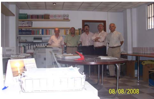
Visita a la sede de la Asociación de algunos vocales al objeto de organizar la biblioteca.

En justicia estamos, de justicia hablamos y la racionalización de los recursos humanos señalamos.