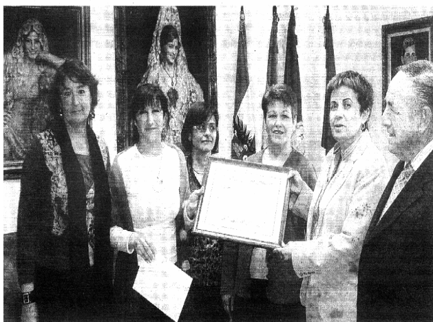
Acto de la entrega del Título de Socio de Honor al Ayuntamiento de Pulpí (Almería).